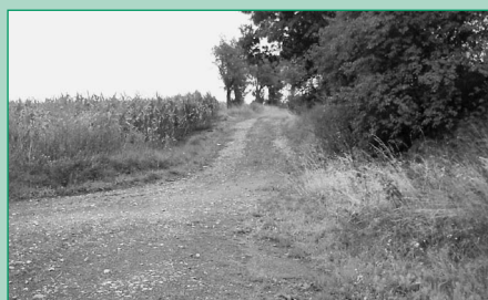
„Brockelsweg“ (Einmündung zur Staatsstraße S 88)

Niedermuschütz das Gelände um den ehemaligen Speicher (Grundstück Hörig) sein. Die Bewohner der Niedermuschützer Straße werden gebeten, die Bushaltestelle in Zehren an der Sparkasse zu benutzen. Der Fährbetrieb wird während der Baumaßnahme aufrechterhalten. In einem zweiten Bauabschnitt wird der Durchlass am Kuhlbach erneuert werden und anschließend der Ausbau der Niedermuschützer Straße von der B 6 her in Richtung Durchlass bzw. Fähre erfolgen. Die Bausumme für Straße und Gehwege beläuft sich auf rund (850.000 Euro) und wird durch den Landkreis getragen. Die Baukosten für den Ausbau des Abwasserkanals mit Pumpwerk belaufen sich auf rund 250.000 Euro, die von der Gemeinde ohne Fördermittel durch Entnahme aus der Rücklage finanziert werden.