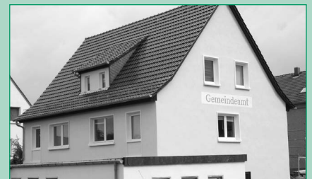
Die Dach- und Fassadensanierung des Gebäudes der Gemeindeverwaltung in Nieschütz ist abgeschlossen.

Begonnen hat auch der Ausbau des „Leichenweges“ in Diera, der im Rahmen der Ländlichen Neuordnung zu 86 % vom Amt für Ländliche