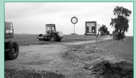
Ausbau des „Leichenweges“

Entwicklung Kamenz und zu 14 % von der Teilnehmergeinschaft mit einem großen Finanzierungsanteil der Gemeinde getragen wird. Nach Plan soll der Ausbau Mitte September beendet sein. Ausgebaut im gleichen Verfahren wird der „Brockelsweg“ – Weg an der Deponie Neumühle (Einmündung zur Staatsstraße S 88) bis Zadel. Bauende wird Ende Oktober sein.