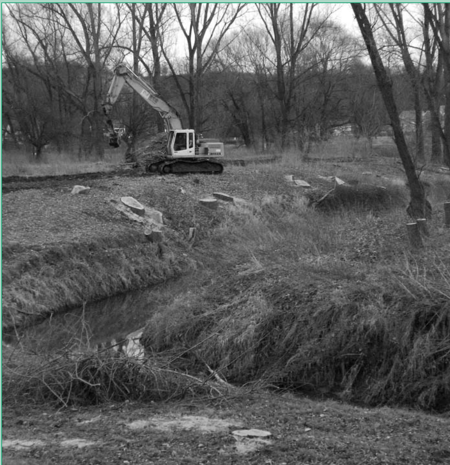
Baumfällarbeiten am Ketzerbach in Vorbereitung des Ausbaus der Ketzerbachmündung in Zehren

Ihr Bürgermeister, Friedmar Haufe 24.01.2008