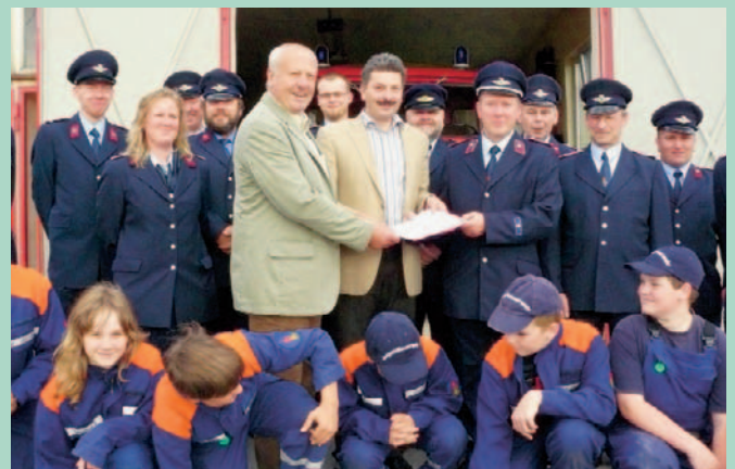
Übergabe Fördermittelbescheid für das neue Feuerwehrgerätehaus in Diera durch den Landrat Arndt Steinbach