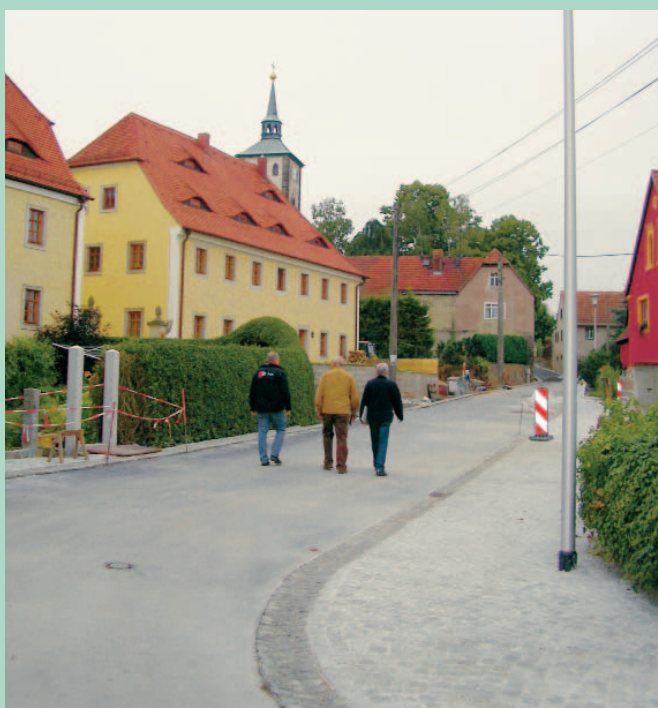
Dorfanger Zadel im Bereich des Weingutes Prinz zur Lippe

Die Tagesordnung dafür entnehmen Sie bitte eine Woche vorher den amtlichen Schaukästen.