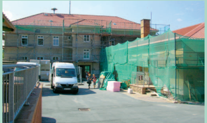
Sanierung der Grundschule Zadel – Straßenansicht (li.) und Hofansicht (re.)