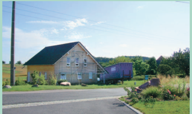
Rechts und links der Elbe entstehen neue Eigenheime – in Kleinzadel (li.) und in Naundorf (re.)