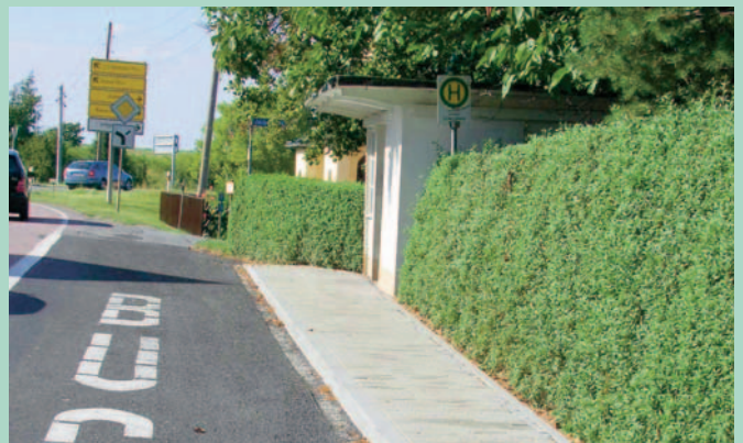
Neu geschaffene Zuwegung Bushaltestelle Naundorf (li.) und Behindertengerechte Zuwegung Bushaltestelle Wölkisch (re.)