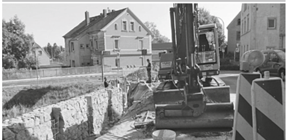
Ausbau Gehweg Seebeschützer Weg – Errichtung Stützwand durch Firma Hoff, Ostrau