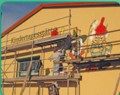
Die Kita wurde immer wieder erweitert und verschönert:

Aus diesem Anlass lädt das „Zwergenland“ Nieschütz zum „Tag der offenen Tür“ am Montag, dem 1. Juni 2015, von 14.30 bis 18.00 Uhr herzlich ein. Viele Höhepunkte erwarten Klein & Groß. Mehr Informationen finden Sie auf Seite 11.