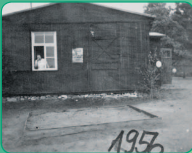
Unsere Kita gestern: