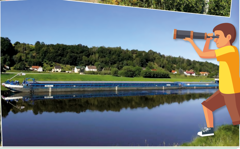
Fotos: Gemeinde Diera-Zehren, Grafik: Designed by iconicbeastary/Freepik